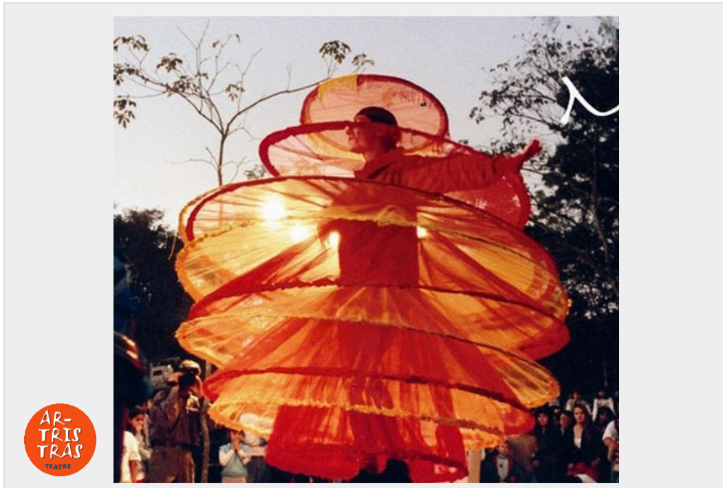
1 PERSONATGE SOL