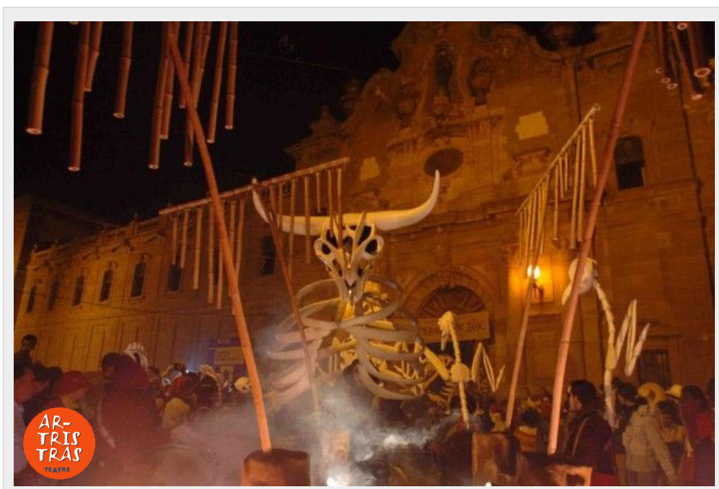
1 ESQUELET TORO I CARRO DE CANYES