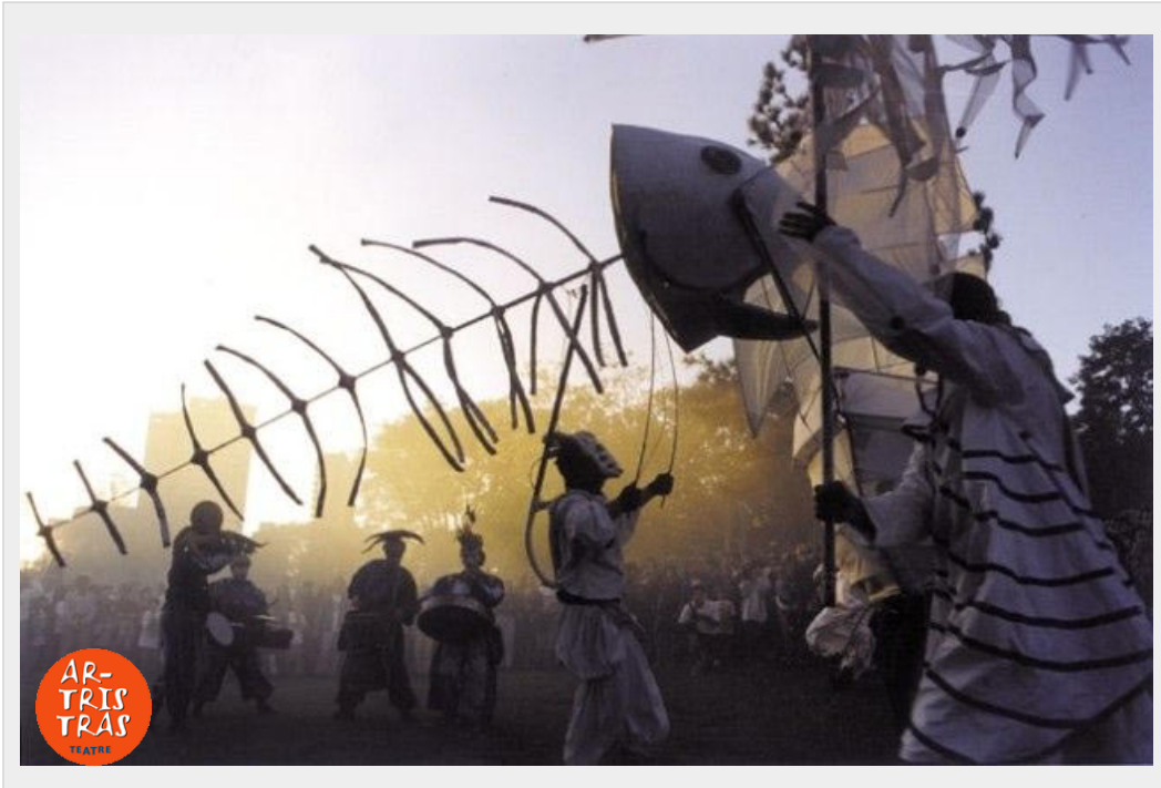
1 ESQUELET SARDINA