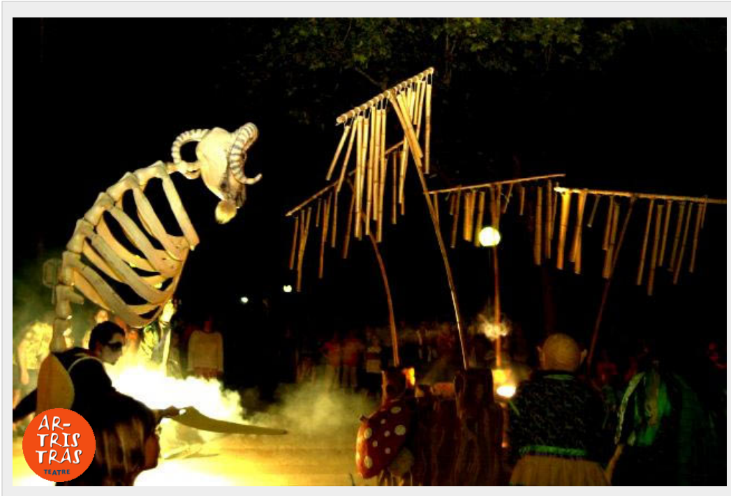
ESQUELET CABRA I CARRO CANYES