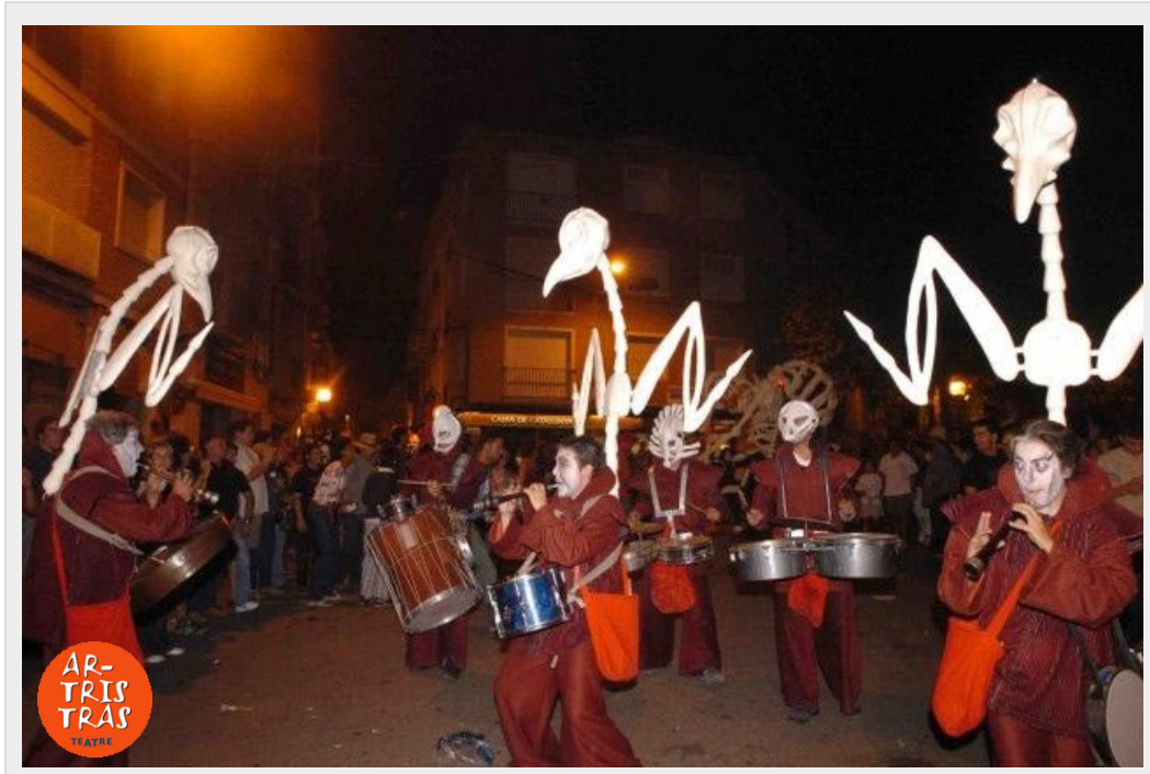
4 o 6 MÚSICS ESQUELETS